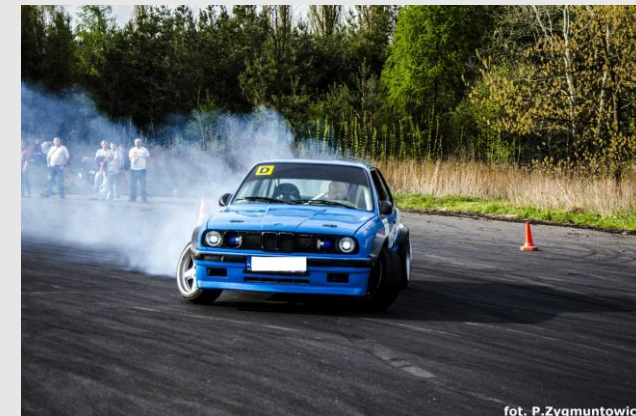
https://bezpiecznapodroz.org/wp-content/uploads/2016/07/10007279_464780256987214_4985538782115150838_o.jpg