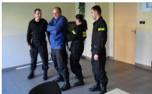
Fot. 21.

Tak nałożony kaftan jeden z policjantów trzyma za tzw. troki (taśmy) rękawów, drugi natomiast zawiązuje troki znajdujące się na plecach osoby (na kokardę jednostronną, aby w razie konieczności szybkim pociągnięciem taki węzeł rozwiązać). Po czym po ich zawiązaniu policjanci chwytają przeciwległe troki rękawów kaftana i oplatają nimi osobę lekko poniżej klatki piersiowej. Oplatanie powinno być realizowane w taki sposób, aby drugie i kolejne owinięcie było umieszczone pod specjalnie przyszytą z przodu kaftana taśmą uniemożliwiającą osobie swobodne przemieszczanie skrępowanych rąk do góry lub w dół. Na końcu policjanci powinni taśmę przyszytą z przodu kaftana przywiązać do dolnych taśm tylnej części kaftana, w ten sposób, aby przechodziła z tyłu do przodu przez krocze osoby i uniemożliwiała przemieszczanie kaftana do góry. Wiążąc taśmy, należy stosować sposób wiązania na tzw. kokardę, która pozwoli unieruchomić osobie kończyny górne, pozbawi ją możliwości samodzielnego rozwiązania taśm i nie dopuści, aby wystąpiło u niej tamowanie obiegu krwi. Zastosowanie przez policjantów przedstawionego sposobu wiązania taśm kaftana daje im w sytuacjach wystąpienia nagłych zagrożeń możliwość szybkiego ich rozwiązania poprzez energiczne pociągnięcie jednej z nich (np. w gdy osoba traci przytomność, blednie, dostanie ataku padaczki itp.).