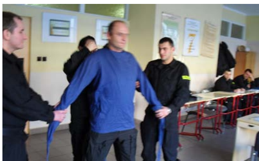
Fot. 20.

Na podstawie doświadczeń pracy policyjnej zaleca się, aby policjanci zakładali kaftan bezpieczeństwa osobie w pomieszczeniach lub innych miejscach odosobnionych bądź niedostępnych dla tzw. osób trzecich. Przy czym przyjmuje się, że w sytuacji gdy osoba, której kaftan jest zakładany, stosuje się do poleceń związanych z jego zakładaniem, czynności takie może realizować dwóch policjantów. Każdy z nich, stojąc przed osobą od strony jednej z jej rąk, chwyta kaftan lewą ręką za jego górną część, przy wlocie rękawa, a prawą – za koniec rękawa, po czym obaj jednocześnie wsuwają rękawy kaftana na wyciągnięte ręce osoby, w ten sposób, że każdy z policjantów wsuwa rękaw od strony swojego ustawienia (fot. 20 i 21).