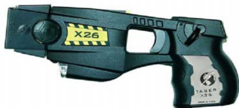
Fot. 28. Taser X26.