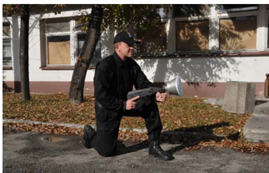
Fot. 17. Postawa strzelecka kłęcząca.