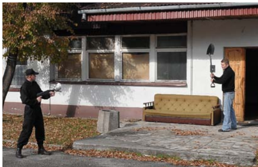
Fot. 16. Postawa strzelecka stojąca.