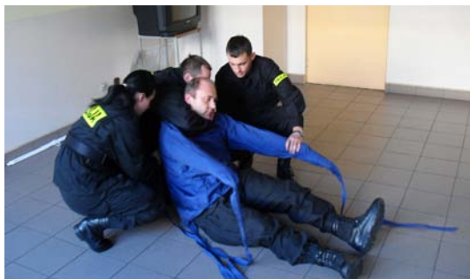
Fot. 22. Zdj. L. Dyduch.

realizacji oraz wszelkie środki ostrożności, szczególnie wykonać je w miejscu niedostępnym dla tzw. osób trzecich.