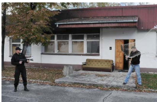
Fot. 18. Sposób użycia siatki obezwładniającej.