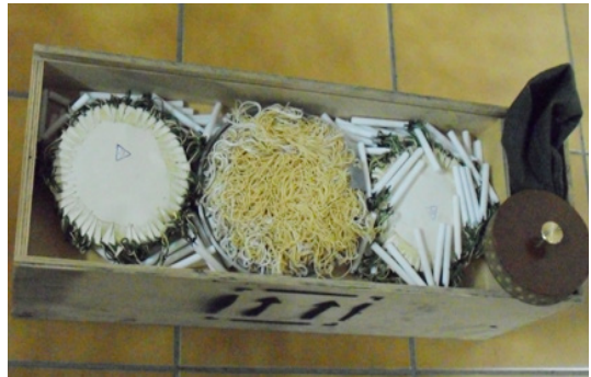
Fot. 4. Zestaw SZO-84 składa się z kielicha, 3 pakietów siatkowych, pokrowca i specjalnego przyrządu do składania siatki. Przechowuje się go w drewnianej skrzynce.

Siatkę obezwładniającą wyrzeliwuje się za pomocą ręcznej wyrzutni granatów łzawiących RWGŁ-3. Na wylotowej części lufy, w miejsce tulei służącej do umieszczania odstrzelianych granatów łzawiących, nakręca się (poprzez wkręcenie gwintowanego od wewnątrz wypustu cylindrycznego) nasadkę w kształcie kielicha (fot. 5, fot. 6).