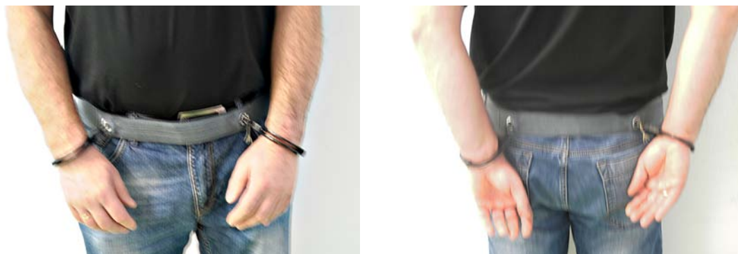
Fot. 23–24. Osoba z założonym pasem obezwładniającym – na ręce trzymane z przodu i na ręce trzymane z tyłu.

wymaga pomocy trzeciego policjanta, który ten pas nakłada w wyżej opisany sposób na ręce osoby obezwładnianej trzymane z tyłu, po tym jak dwaj pozostali policjanci obezwładnią osobę za pomocą siły fizycznej w postaci chwytów dźwigni stawowo-barkowych 55 .