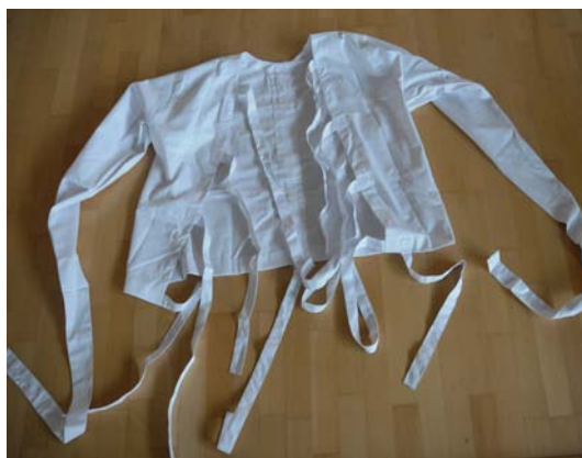
Fot. 19. Kaftan bezpieczeństwa koloru białego (nowy wzór).