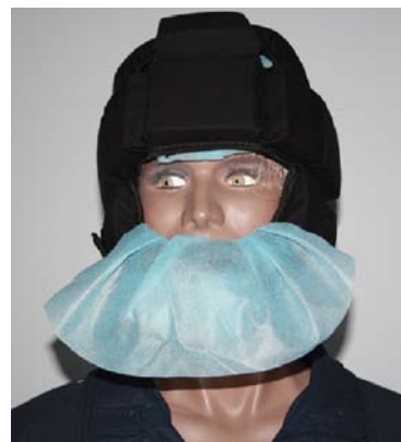
Fot. 26–27. Kask zabezpieczający po założeniu na głowę manekina. Źródło: „Gazeta Policyjna” (zdjęcia udostępnione przez TM Moratex), za: L. Dyduch, Środki przymusu bezpośredniego. Ich posiadanie, użycie i wykorzystanie przez policjantów , s. 90.