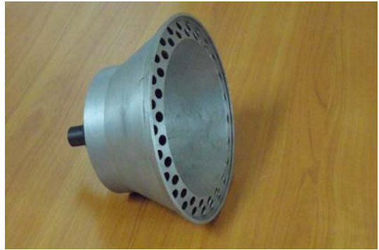
Fot. 6. Nasadka do wyrzeliwania siatki.