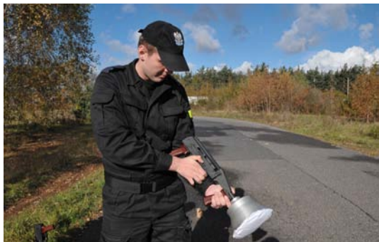
Fot. 15. Ręczna wyrzutnia granatników łzawiących.