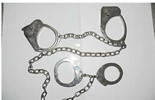
Fot. 3. Kajdanki zespolone.

Prawidłowe i sprawne zakładanie kajdanek wymaga od policjanta przestrzegania następujących etapów postępowania: