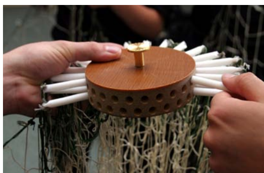
Fot. 11–12. Przyrząd specjalny do składania siatki.

kruszeń lub modyfikacji parametrów, gdyż takie zmiany mogłyby negatywnie wpływać na rozwijanie siatki po jej wyrzeleniu. Tłoczki powinny być mocno połączone z siatką, aby po wyrzeleniu nie nastąpiło ich oderwanie i przypadkowe rażenie osoby objętej czynnościami obezwładnienia lub osób postronnych. Siatka po wyrzeleniu w odległości 2 m od wylotu nasadki rozwija się w kształt koła o średnicy ok. 2 m, które powiększa się w miarę jej lotu aż do uzyskania pełnej średnicy ok. 4 m na odległości 8–10 m. Następnie w momencie trafienia w osobę owija się wokół niej, krępując ruchy jej kończyn, mogąc nawet ją przewrócić.