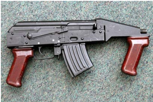
Fot. 5. Ręczna wyrzutnia granatów łzawiących RWGŁ-3.