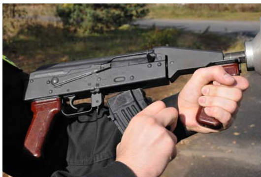
Fot. 13–14. Łączenie nasadki z wyrzutnią granatów łzawiących RWGŁ-3. Zdj. L. Dyduch.