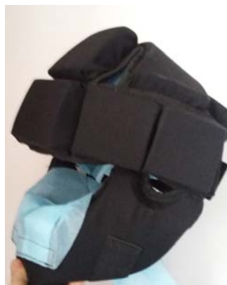
Fot. 25. Kask zabezpieczający ze specjalną chustką zapobiegającą wydostawaniu się śliny na zewnątrz ust.

Kasku zabezpieczającego można użyć także prewencyjnie w celu zapobieżenia ucieczce osoby ujętej, doprowadzanej, zatrzymanej, konwojowanej lub umieszczonej w strzeżonym ośrodku, areszcie w celu wydalenia lub osoby pozbawionej wolności, a także w celu zapobieżenia objawom agresji lub autoagresji tych osób 57 .