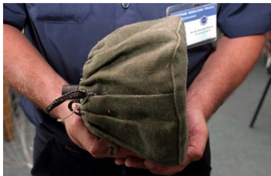
Fot. 9–10. Pakiet siatkowy.