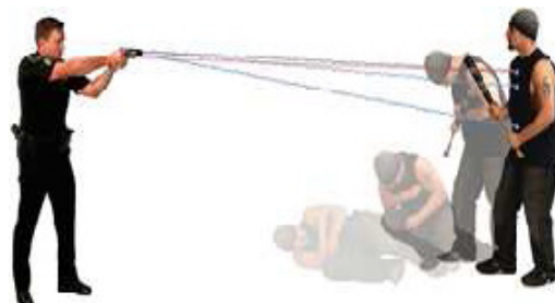
Fot. 29. Użycie Tasera.

Używając przedmiotów przeznaczonych do obezwładniania osób za pomocą energii elektrycznej, nie celuje się w głowę 63 .