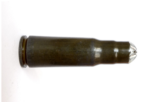
Fot. 7. Uniwersalny nabój miotający 7,62 mm UNM wz. 1943.