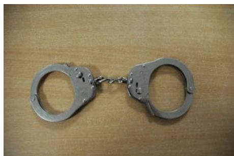
Rys. 1. Budowa kajdanki zakładanych na ręce. Autor: L. Dyduch.