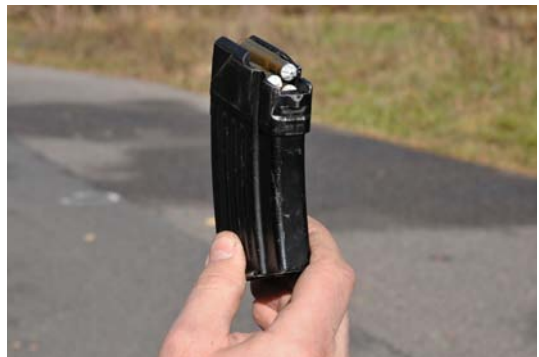
Fot. 8. Magazynek łukowy uniwersalny RWGŁ-3.